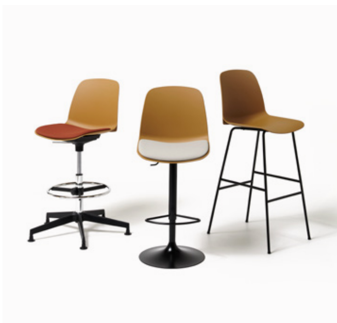
Ocra - One 4566 / Ocra - Jet 9110 / Ocra