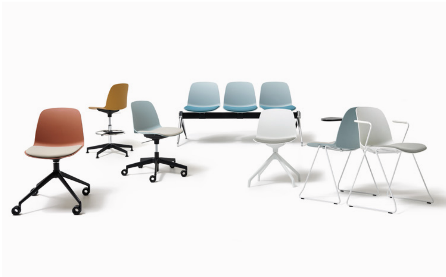
Mattone - Jet 9110 / Ocra / Azzurro - Jet 9110 / Azzurro - Era CSE20 / Bianco - Jet 9110 / Azzurro - Jet 9110 / Bianco - Jet 9110