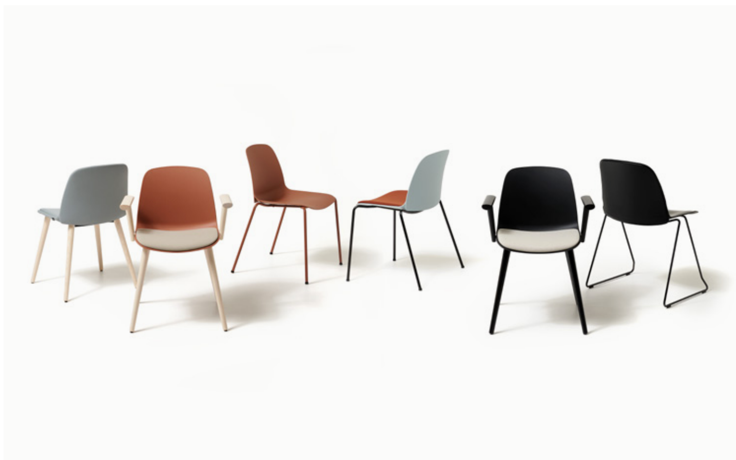
One 8032 / Mattone - Jet 9110 / Mattone / Azzurro - One 4566 / Nero - Jet 9110 / Cuoio Nero

Réinterprétation de la chaise monocoque multifonctionnelle, la Collection KIRE, conçue par Giorgio Topan, prix de l'inspiration à partir de la signification de son nom: "couper". Légère, incontournable, avec des références au design scandinave, il est facilement reconnaissable grâce à sa silhouette latérale. La liberté de mouvement offerte par sa forme et les possibilités infinies de combinaisons, en faites une famille polyvalente de sièges avec un look linéaire et contemporain, adaptée à tout environnement: bureau, maison et espaces publics.