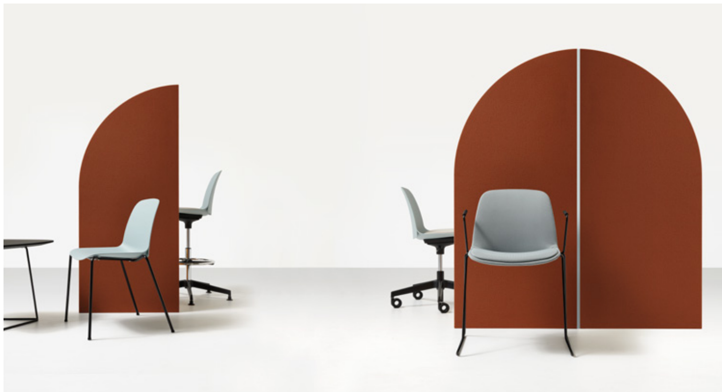
Azzurro / Azzurro - Jet 9110 / Azzurro - Jet 9110 / One 8032