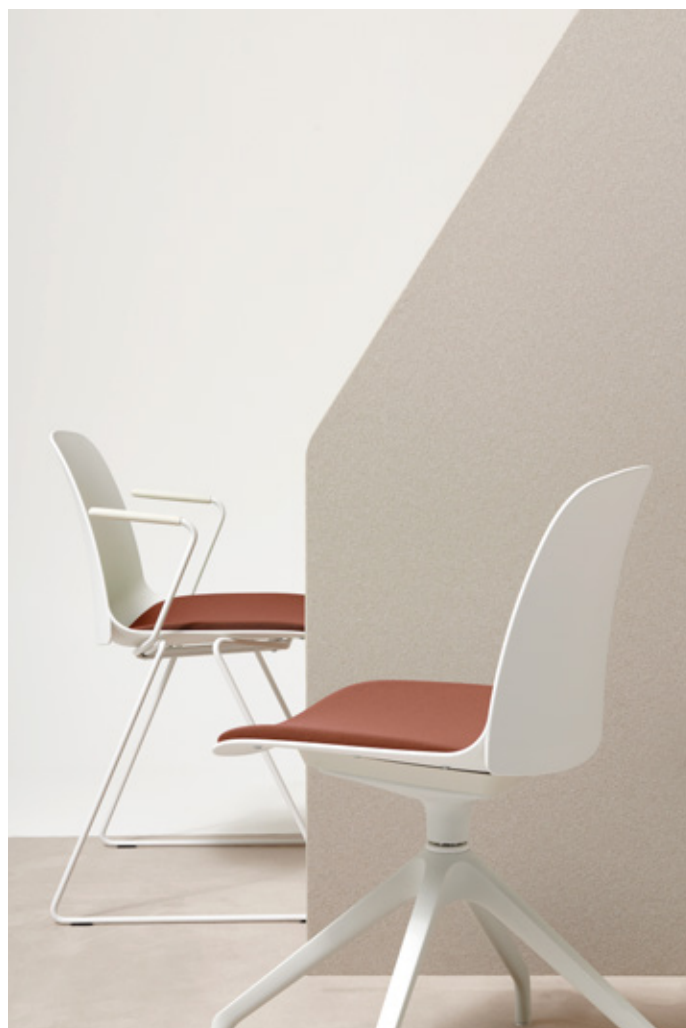
Bianco - One 4566