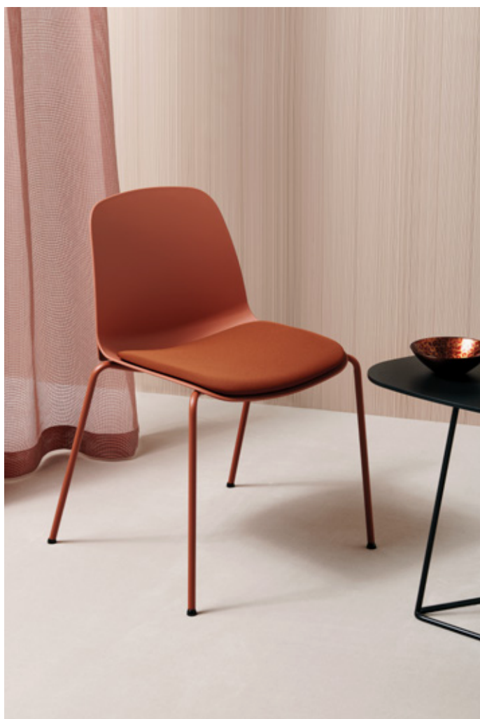
Mattone - One 4566