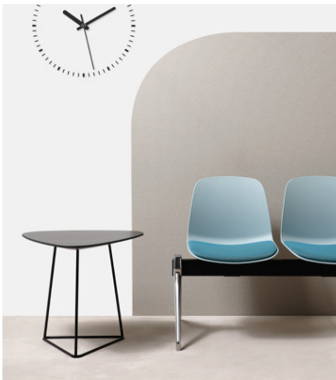
Azzurro - Era CSE20