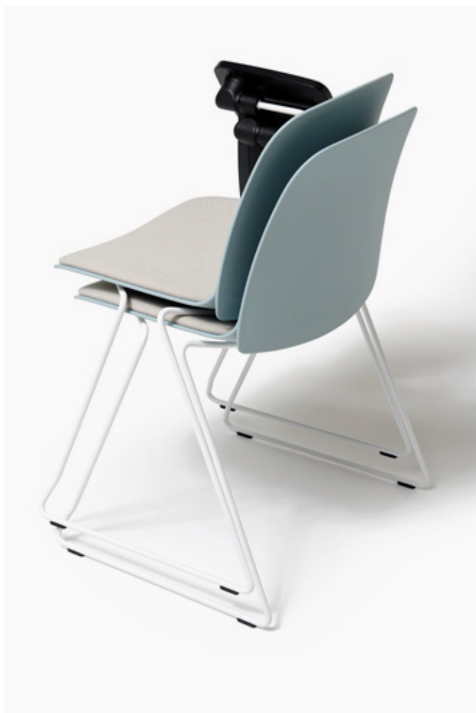
Azzurro - Jet 9110